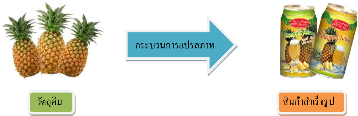
ภาพที่ 1.3 แสดงตัวอย่างการผลิตน้ำผลไม้กระป๋อง