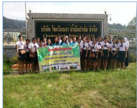
ภาพที่ 1.1 ตัวอย่างกิจการอุตสาหกรรม

ที่มา : ภาพถ่าย โดย นงคราญ ช่างสาน เมื่อวันที่ 3 กุมภาพันธ์ 2559