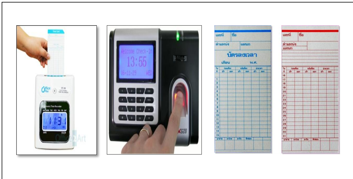
ภาพที่ 3.1 ตัวอย่าง บัตรลงเวลา

ที่มา http://www.office2art.com , 2560 : (Online) ที่มา https://cctvchiangrai.files.wordpress.com , 2560 : (Online)